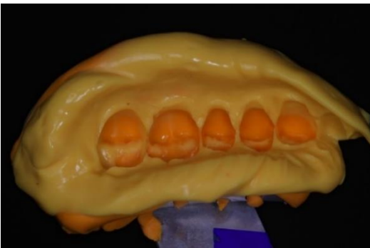
Figura 3. Resultado da moldagem de um passo de dupla viscosidade com predominância da silicona fluida.