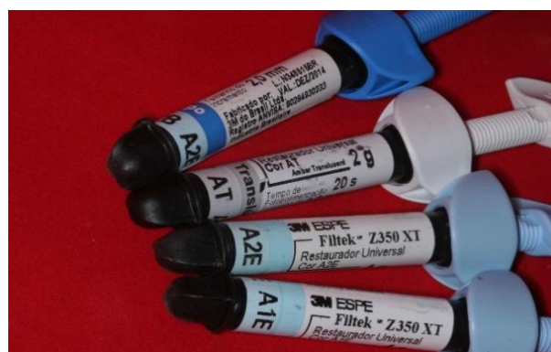
Figura 8 - Resinas compostas utilizadas

O acabamento foi realizado inicialmente através da remoção dos excessos grosseiros com lâmina de bisturi nº 12 (Solidor- Diadema, SP, BR) seguido do uso de pontas diamantadas finas e ultrafinas 2200F, 2200FF, 3168F e 3168FF (KG Sorensen- Barueri, SP, BR). O polimento foi realizado com borrachas abrasivas (Jiffy