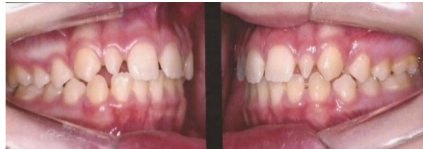
Figura 2 - Aspecto oclusal inicial direito e esquerdo, com presença de diastemas patológicos