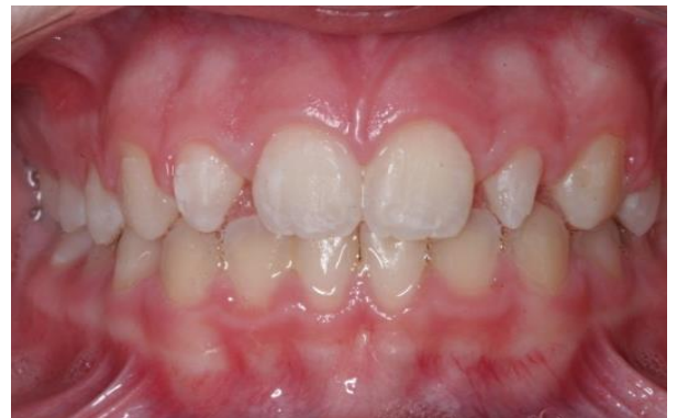
Figura 5 - Aspecto da oclusão após conclusão do tratamento ortodôntico.