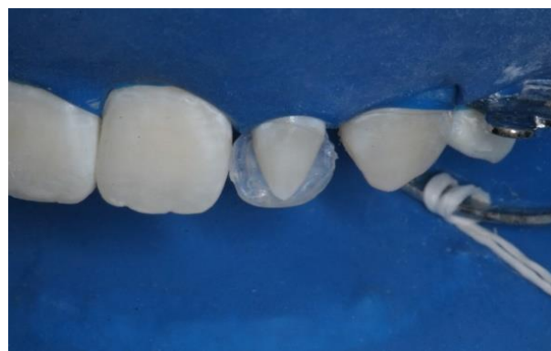
Figura 7 - Resina composta translúcida aplicada na face palatina do incisivo lateral