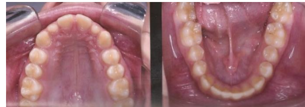
Figura 3 - Aspecto oclusal superior e inferior.