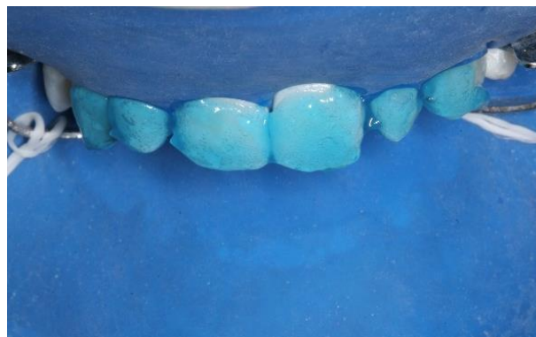
Figura 6 - Condicionamento ácido

Após a lavagem e secagem do ácido, o adesivo foi aplicado com auxílio de pincel descartável (microbrush) em duas camadas, de acordo com as recomendações do fabricante. A resina composta selecionada foi a nanoparticulada Z350XT (3M/ESPE®) nas cores AT, A1E, A2E e A2B (Figuras 7 e 8), sendo inseridas em incrementos com a utilização de espátulas para resina (Millenium-Golgran, São Caetano do Sul, SP, BR) e adaptadas à cavidade com auxílio de pincel para resina (Cosmedent nº3, Chicago, IL, USA), inicialmente com o auxílio da muralha de silicone com a camada de resina translúcida, e posteriormente com as resinas de corpo e de esmalte, para finalizar. Tanto a resina composta quanto o sistema adesivo foram fotoativados através da unidade Bluephase (Ivoclar/Vivadent, Schaan-Liechtenstein, Alemanha), com intensidade de luz de 1.200mW/cm 2 por 15 segundos e 18J de potência.