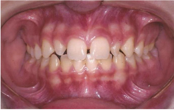
Figura 1 - Aspecto inicial frontal da oclusão com presença de diastemas patológicos e desvio de linha média superior para esquerda