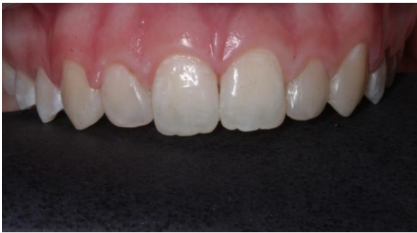
Figura 9 - Aspecto final das restaurações realizadas

Polisher-Ultradent, Curitiba, PR, BR) seguidas por discos abrasivos de granulação fina (3M-ESPE®) e por discos de feltro associado à pasta de polimento (FGM - Joinville, SC, BR). A Figura 9 mostra o aspecto final das restaurações após acabamento e polimento.