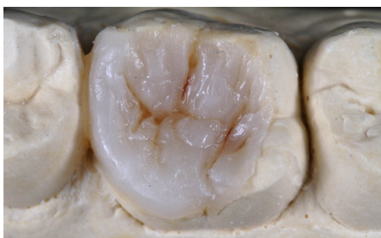
Figura 8. Restauração semidireta finalizada, pronta para ser cimentada.

Ao final pode-se observar uma peça rica em detalhes e com acabamento e polimento excelentes (Figura 8).