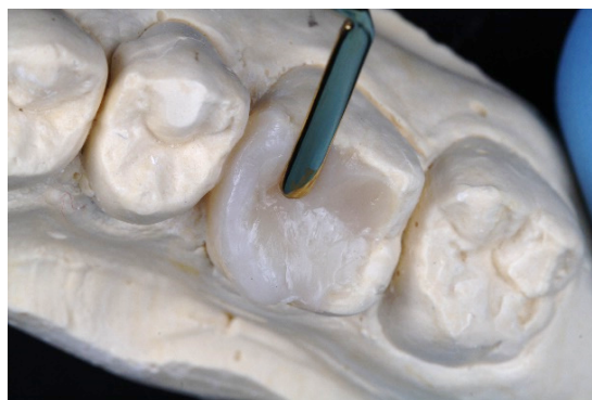
Figura 4. Inserção da resina de esmalte Filtek™ Z350 XT sobre a resina hiper Cromática.

recobrimo a resina hiper Cromática até a margem do ângulo cavossuperficial (Figura 4). O excesso foi retirado com espátula para resina composta plana (Quinelato®), em um ângulo de 45° em relação à ponta das cúspides (Figura 5).