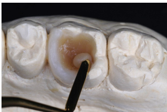
Figura 3. Inserção da resina hiper Cromática A6B Filtek™ Z350 XT no fundo da cavidade em formato

Sobre o fundo do preparo foi inserida uma camada de resina hiper Cromática A6B Filtek™ Z350 XT (3M®), dando formato côncavo e liso ao material, eliminando assim, qualquer área retentiva que possa dificultar o assentamento passivo da restauração. Após essa fase realizou-se novamente a fotoativação por 20 segundos (Figura 3).