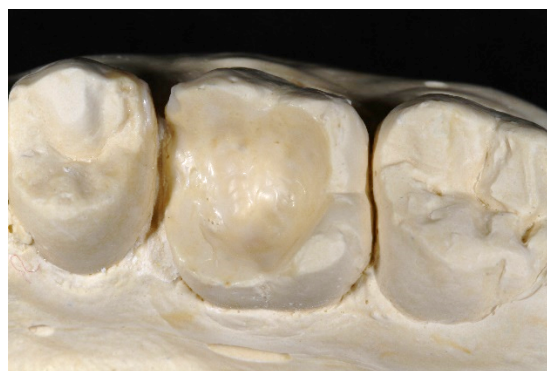
Figura 1. Isolamento interno do preparo no modelo, com fina camada de cera para escultura.

No modelo em gesso tipo IV FujiRock (GC Europe, Leuven, BEL), o dente foi isolado com uma fina camada de cera de escultura Artwax (Morsa GmbH, Krumbach, GER) em toda a extensão interna do preparo para que a resina não se fixe ao gesso e para simular o espaço para o cimento (Figura 1).