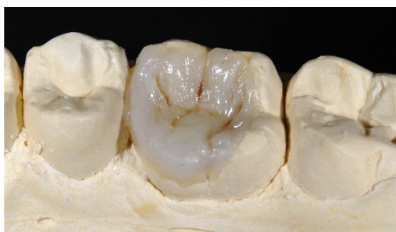
Figura 7. Corantes aplicados nos sulcos principais e secundários