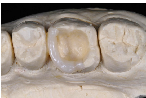
Figura 2. Fechamento da caixa proximal com resina de esmalte Filtek™ Z350 XT na cor XWE.

Em seguida, com uma espátula de inserção (Quinelato, Rio Claro, SP, BR) acrescentou-se uma camada de resina de esmalte (Filtek™ Z350 XT, 3M®, Sumaré, SP, BR) para o fechamento da caixa proximal, transformando uma complexa cavidade classe II em uma cavidade classe I, facilitando sobremaneira a execução dos outros passos da técnica. Realizou-se, então, a fotoativação (VALO - Ultradent, South Jordan, UT, USA) durante 20 segundos (Figura 2).